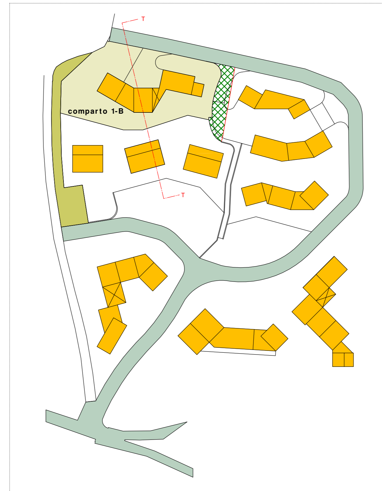
STATO DI FATTO: planimetria generale - scala 1:1000 Comparto 1-B: Sup. mq. 1936,00 Stralcio area Comparto 2: Sup. mq. 150,00 Superficie totale mq. 2086,00