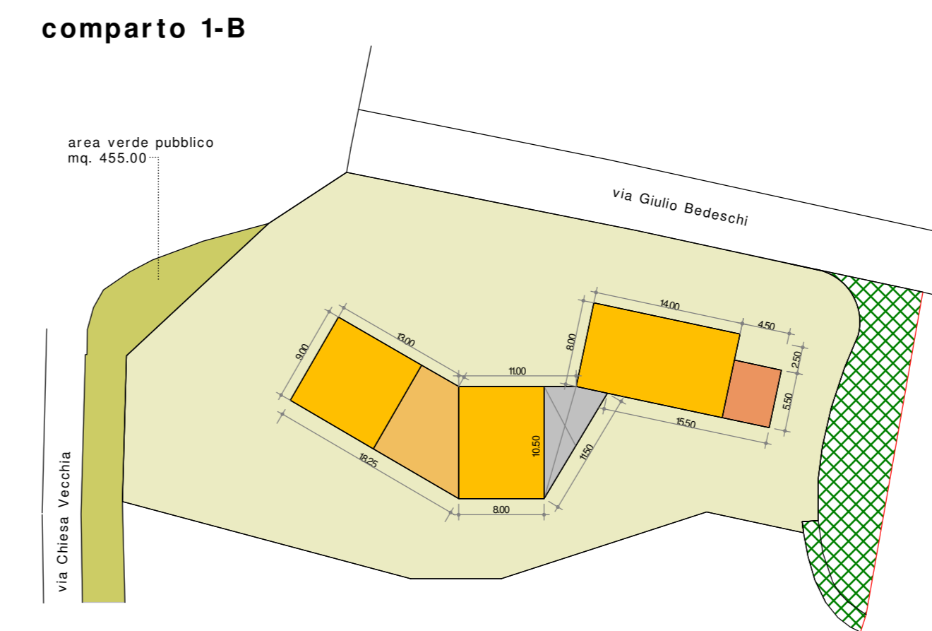
Legenda: area a giardino Comparto 1-B - dati metrici Superficie fondiaria: mq. 1936.00 Superficie coperta: mq. 393.10 Volume: mc. 2682.00 (Vol. Comparto 1 - Variante "A") Porzione Comparto 2 Superficie fondiaria: mq. 150.00 Indice di edificabilità: 1.50 mc./mq. Volume: mc. 225.00 Dati metrici complessivi Superficie fondiaria: mq. 2086.00 Volume: mc. 2907.00