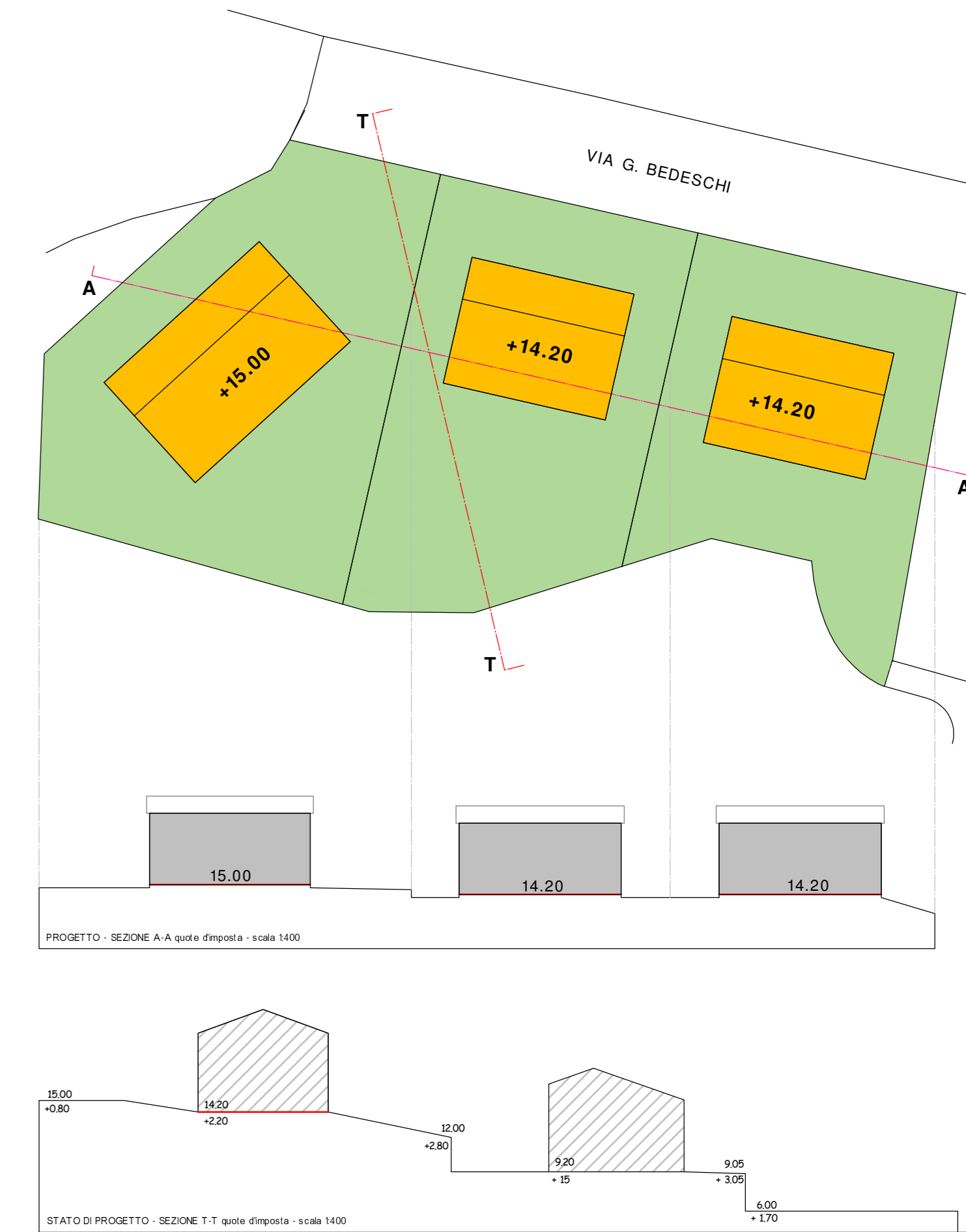
STATO DI PROGETTO: planimetria-sezioni - 1:400