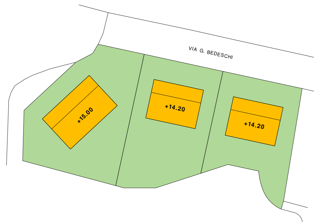
STATO DI PROGETTO: quote d'imposta edifici - scala 1:500