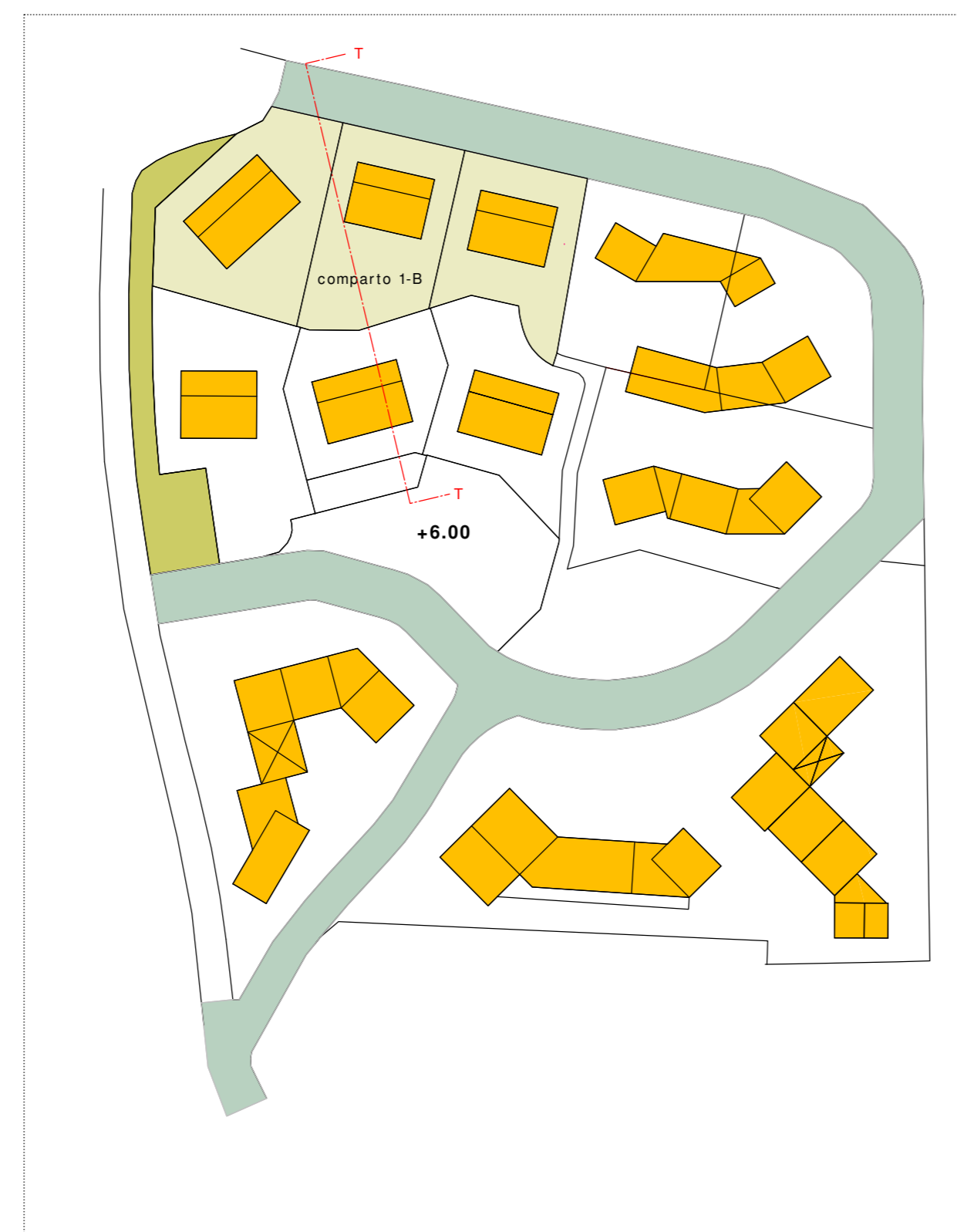
STATO DI PROGETTO: planimetria generale - 1:1000