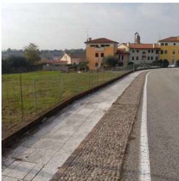
N.3 Vista ingresso da Est