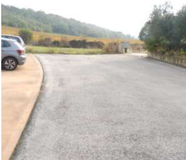
N.1 Vista ingresso da accesso su pubblica Via -Sub.n.27