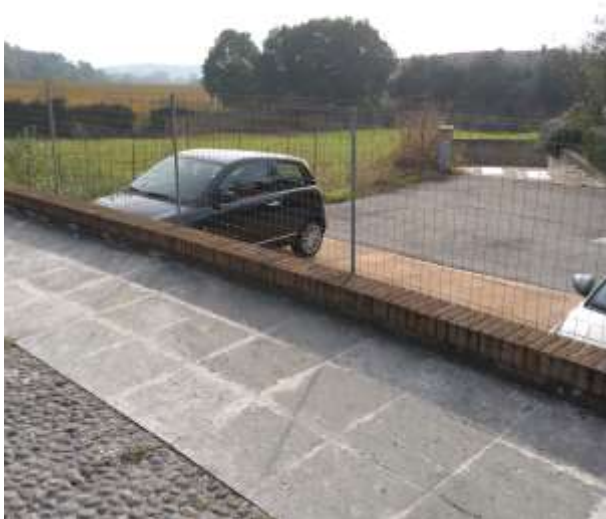
N.2 Particolare Ingresso